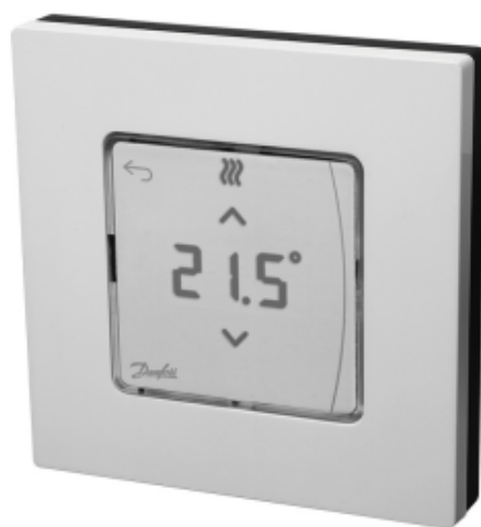
Danfoss Icon™ Display

Комнатный термостат типа Icon™ Display применяется для управления системой водяных теплых полов. Обеспечивает регулирование комнатной температуры в соответствии с потребностями пользователя, энергосбережение и комфорт.